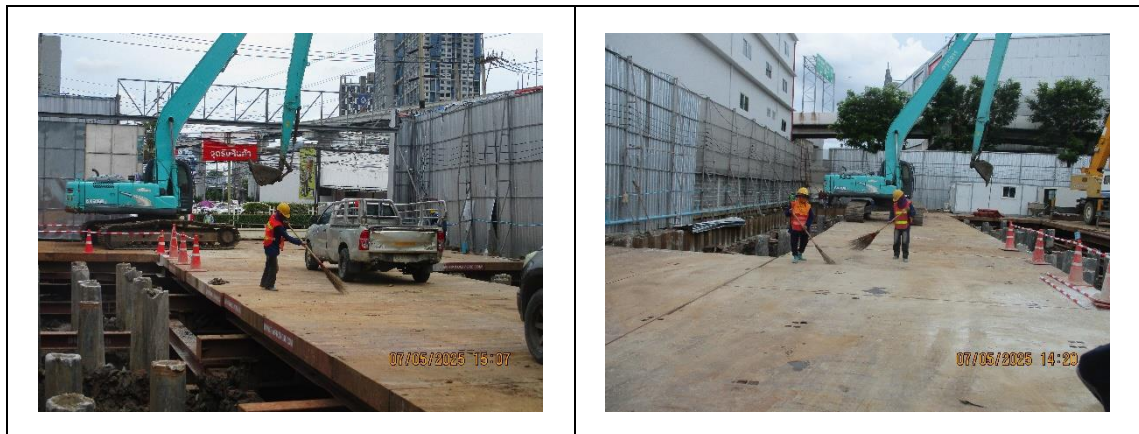
รูปที่ 4 เจ้าหน้าที่กวาดฝุ่น