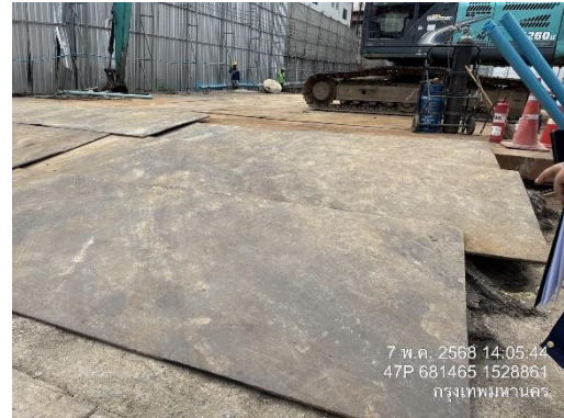
รูปที่ 8 แผ่นเหล็ก