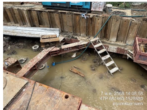
รูปที่ 9 ป้มน้ำ