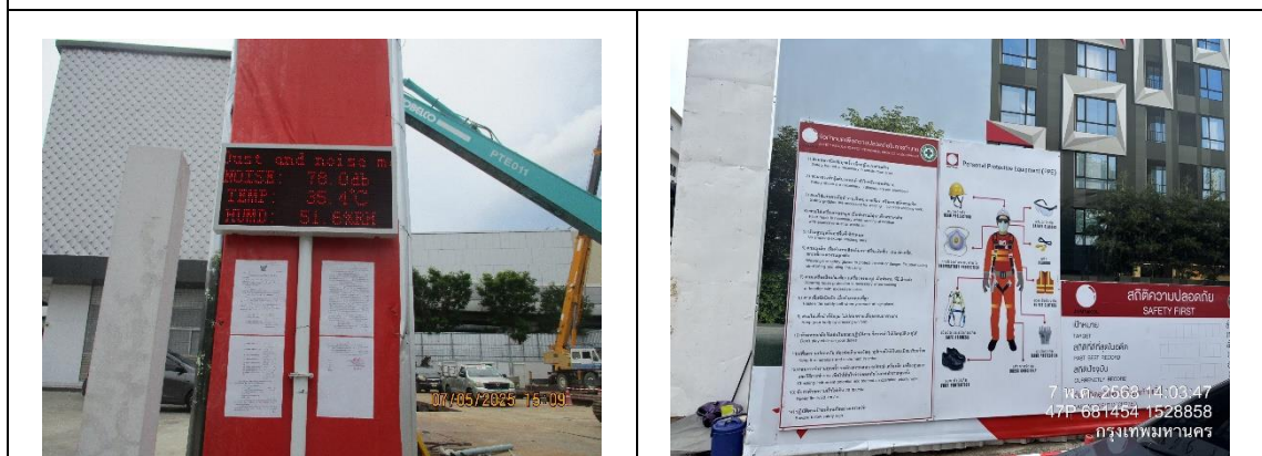
รูปที่ 6 เครื่องตรวจวัดคุณภาพสิ่งแวดล้อม แบบเรียลไทม์