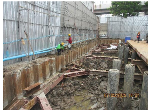
รูปที่ 10 แนว Sheet Pile และทำค้ำยันเหล็ก (Bracing)